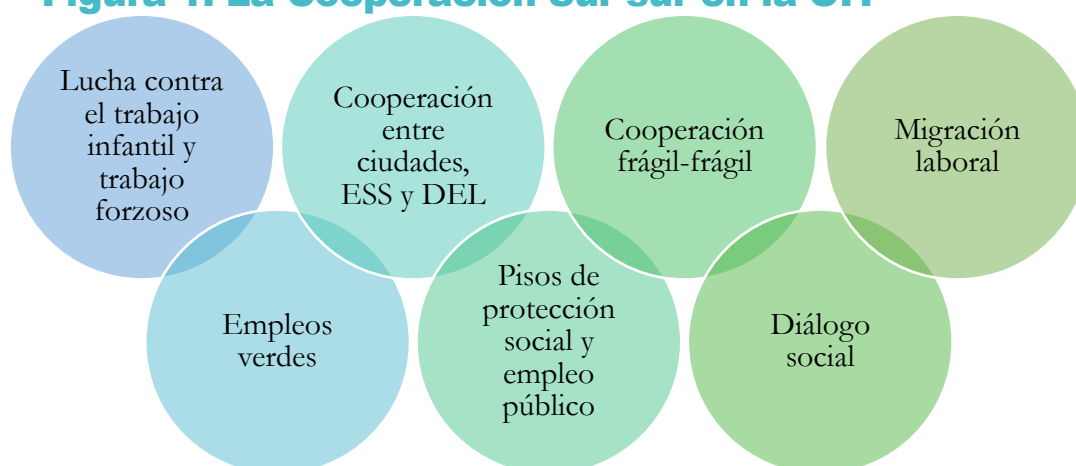
Figura 1. La Cooperación Sur-sur en la OIT

La OIT actúa como mediador, agente de conocimiento, constructor de alianzas y analista de la cooperación Sur-Sur y triangular de un determinado país en el contexto de la Agenda de Trabajo Decente. Este compromiso se pone en práctica mediante la facilitación de actividades para mejorar el diálogo social; la investigación, la identificación y difusión de buenas prácticas; el desarrollo de plataformas web que fomentan las interacciones de intercambio de conocimientos en línea para mantener a los agentes de cooperación Sur-Sur y triangular actualizados; la mediación en los procesos de creación de asociaciones; y la facilitación de foros de intercambio de conocimientos y actividades de aprendizaje de igual a igual, entre otros.